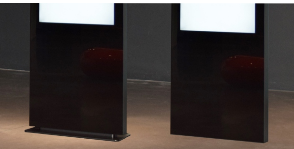
Installazione con base o direttamente a pavimento