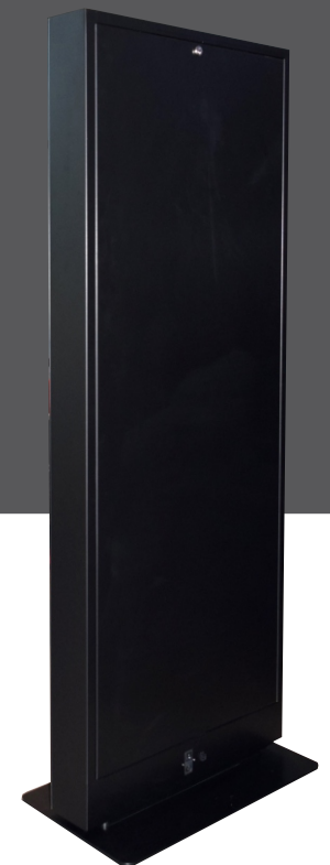
posteriore privo di prese d'aria e viti a vista