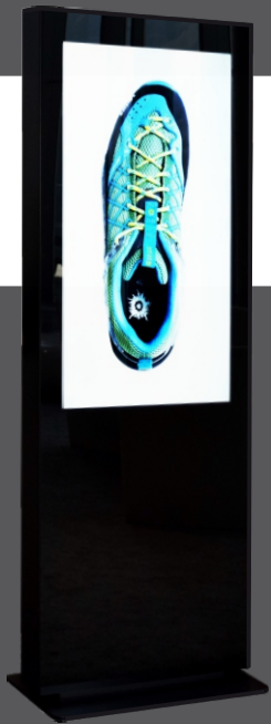
Mod. linear design essenziale ed elegante

struttura completamente priva di viti a vista - verniciatura a polveri antigraffio - colori standard: Bianco (Ral 9016); Nero (Ral 9005); Rosso (Ral 3000). possibilità di personalizzazione con colori di gamma Ral o serigrafie «digital Imaging» - installazione con base o direttamente a pavimento Optionals: Funzione multi-touch; player «digital signage»; piattaforma cloud; sviluppo grafico; gestione dei contenuti e delle pubblicazioni