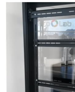
Supporto adattabile a qualsiasi Display