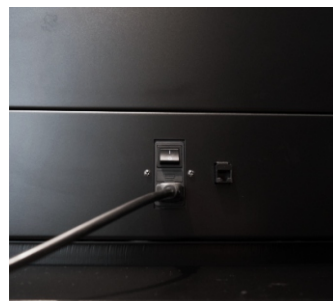
Ingresso alim. con interruttore presa LAN conn. RJ45