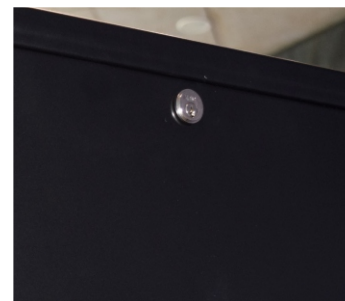
Chiusura pannello posteriore a chiave